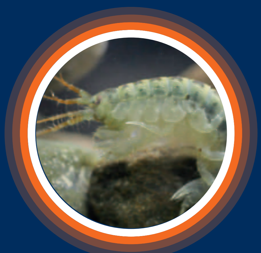
Gammare du Danube