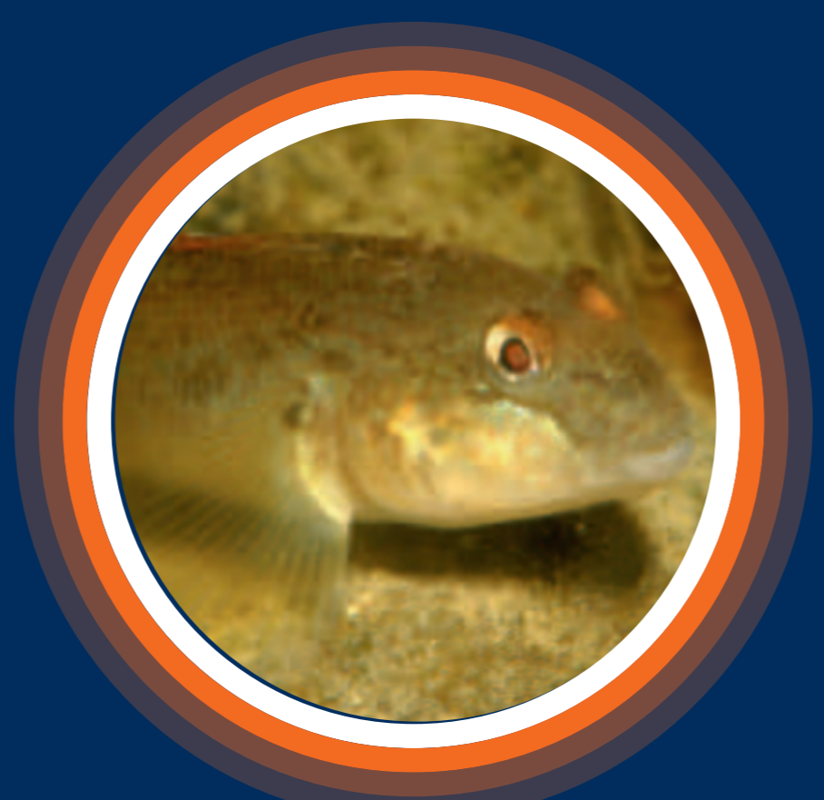
Gobie à taches noires